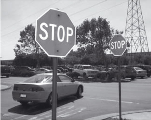
Haltŝildoj sur ĉiu stratangulo

up?» kaj respondi «What's up?» aŭ «Not much» («Ne multe»).