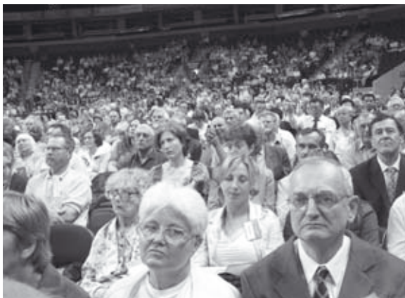
Er dette ein elite? (Bilete frå den formelle opninga av esperanto-verdskongressen i Vilnius 2005).

Han viser til at ulike granskingar har påvist at esperantobrukarar i snitt snakkar ca. 2–3 språk i tillegg til esperanto og morsmålet. Esperanto-språksamfunnet er dermed ikkje heilt i samsvar med den anti-elitistiske ideologien. Ei gransking frå